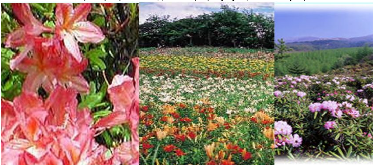
鹿沢高原レンゲツツジ 鹿沢ゆり園 浅間高原 しゃくなげ